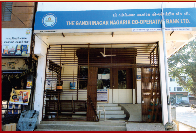
સેક્ટર-૨૪ ડિસ્ટ્રીક્ટ શોપીંગ શાખા